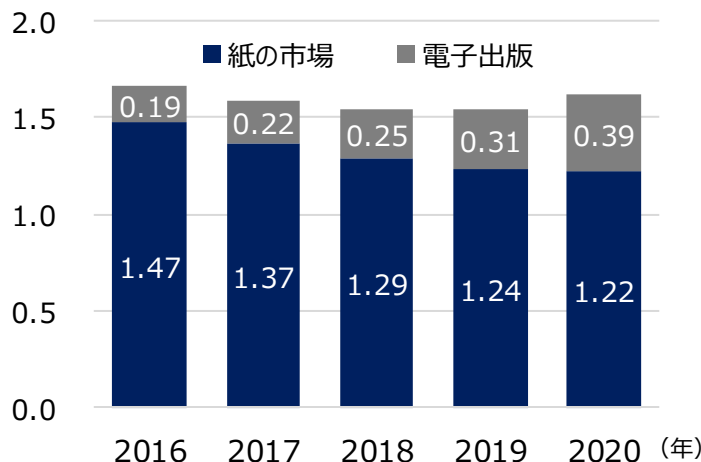
(兆円) <日本の紙・電子合算の出版市場規模推移>

参照：公益社団法人 全国出版協会・出版科学研究所のデータをもとにインベスコ作成。