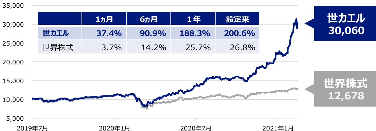
＜世カエルと世界株式の推移＞ (2019年7月11日～2021年2月26日、日次)

※世界株式：MSCIワールド指数（トータルリターン、円ベース）