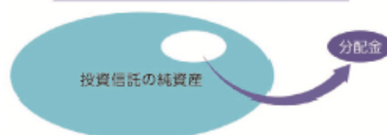
投資信託で分配金が支払われるイメージ